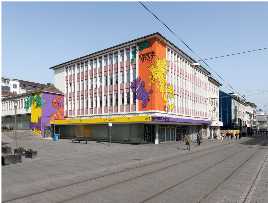
Ein Möglichkeitsraum, um Projekte umzusetzen: Das ruuHaus in Kassels Innenstadt. Nicolas Wefers

Das alte Kaufhaus in der Kasseler Innenstadt, das Ruangrupa zu ihrem Wohn- und Arbeitszimmer erklärt hat, war pandemiebedingt bisweilen zwar sehr verwaist – allein die lila, gelben und grünen Farbleckswesen schienen sich hier aufzuhalten, die zur visuellen Identität der englisch genannten Documenta fifteen beitragen sollen und in grossem Massstab auf die Fassade geklebt wurden.