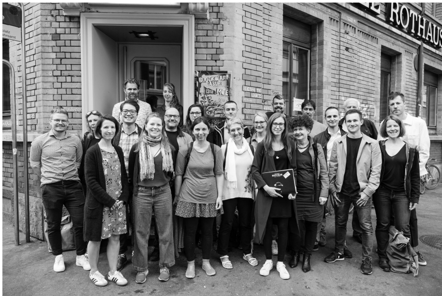
Der Genossenschaftsrat vor seiner Sitzung vom 14. September 2019. Nick Lobeck

Am Anfang war Gewusel. Es war unser Versuch, mitten auf dem Trottoir zwischen Vorbeilenden ein Bild vom Genossenschaftsrat für Sie zu machen. Wir wuseln, also sind wir. Und inzwischen wuseln wir bereits so geordnet wie Ameisen am Bau.