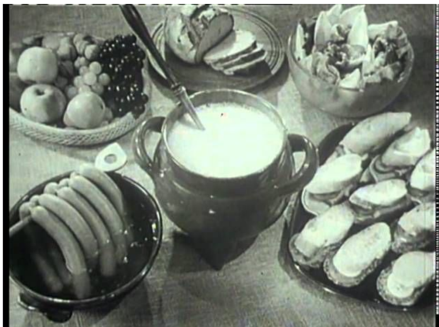
Allerster Werbeblock des Schweizer Fernsehens

1965: Einführung der TV-Werbung, beschränkt auf 12 Minuten täglich. 6000 Franken kostet die Minute. Am bisher sendefreien Dienstagabend werden neu Kulturbeiträge ausgestrahlt.