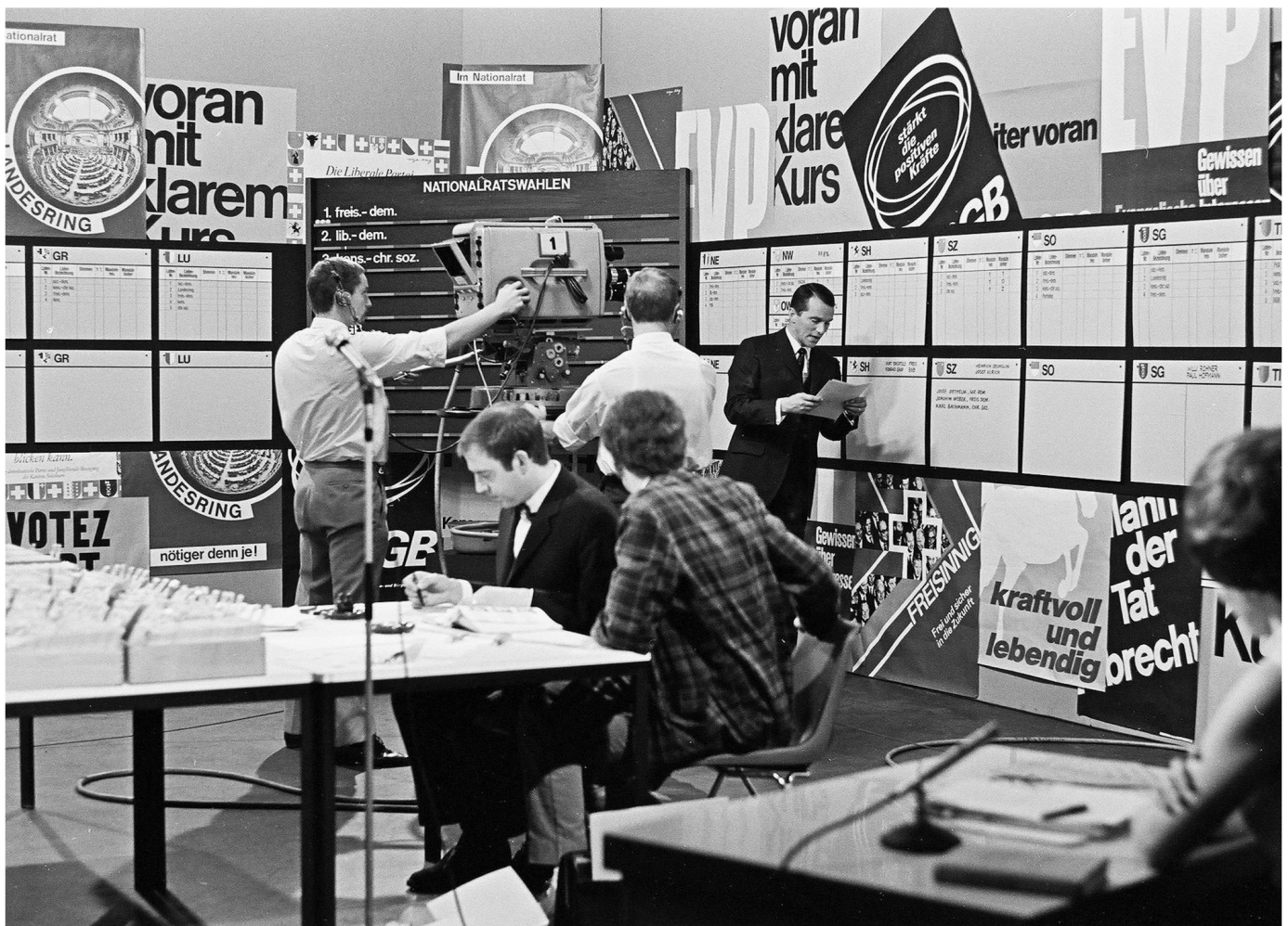
Wie mächtig ist das Fernsehen? Sendung zu den Nationalratswahlen 1967. SRF