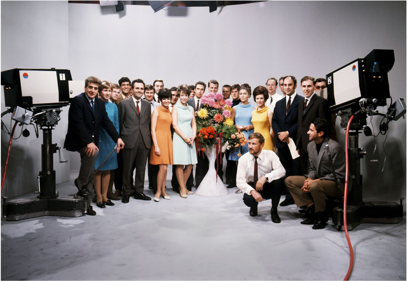
Die SRG wird bunt: Aufnahme des Farbfernseh-Betriebs am 1. Oktober 1968. SRG

1968: Einführung des Farbfernsehens. Eine Million TV-Konzessionäre.